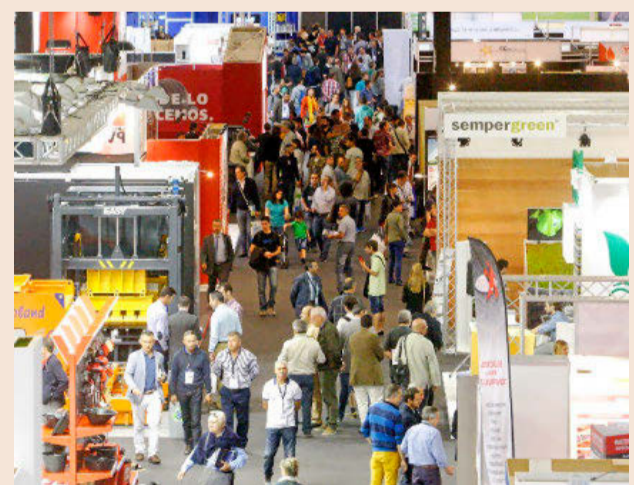
Imagen de la última edición de BBConstrumat, en 2015.

mostrarán sus nuevas ideas en los diferentes ámbitos de la construcción. Future Arena contará con un showroom en el que las empresas del sector podrán exponer sus principales novedades. También albergará un área de start up , donde las firmas de reciente creación mostrarán las tendencias punteras en construcción. Este espacio cuenta con la colaboración de 4YFN, el evento vinculado al Mobile World Congress. Las otras dos áreas serán un foro de presentaciones y charlas y la zona de centros tecnológicos,