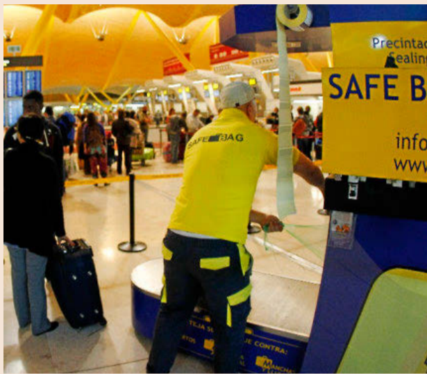
Barajas (Madrid) recibió 50,42 millones de pasajeros en 2016.

Como resultado, Sinapsis, que opera en otros 11 aeropuertos españoles, cifra el daño en 14,69 millones por la duración del contrato, ya que un mercado de 1,2 millones de maletas al año y 10 millones de euros "se ha quedado reducido a 600.000 maletas y 5 millones", según Talín. La demanda, por la vía penal, está en proceso de admisión a trá-