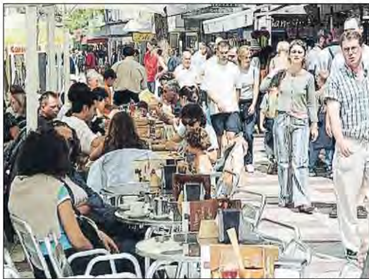
La restauración ha sido uno de los epígrafes más inflacionistas

negativos. El Gobierno sostiene que el año acabará con una inflación que se situará en el entorno del 1%.