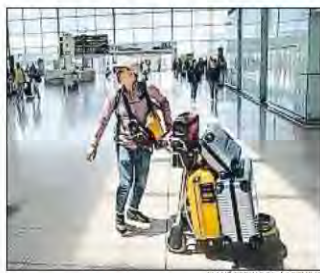
Imagen de la T1 de El Prat

■ El aeropuerto de El Prat acumula un incremento del 7,7% del tráfico de pasajeros hasta el mes de septiembre, con una cifra total de 36,7 millones. Durante el pasado mes de septiembre pasaron por el aeropuerto de Barcelona 4,6 millones de viajeros, un 6,4% más que el año anterior. El tráfico interno creció un 7,2%, mientras que los usuarios internacionales aumentaron un 6%. / Redacción