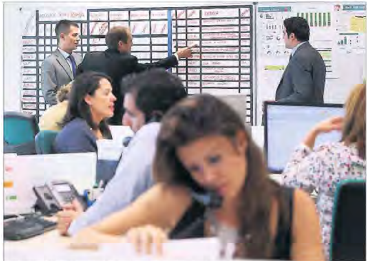
Trabajadores de una empresa de renting de vehículos.