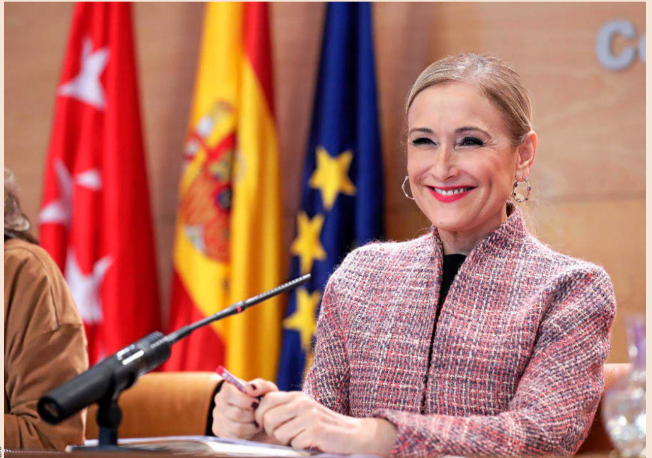
La presidenta de la Comunidad de Madrid, Cristina Cifuentes, ayer durante la rueda de prensa.

Respecto al IRPF, indicó que la rebaja de medio punto en el tramo autonómico "beneficiará a todos los contribuyentes madrileños, pero especialmente a las rentas más bajas". Así, señaló que se rebaja un 5,3% el primer tramo, "por