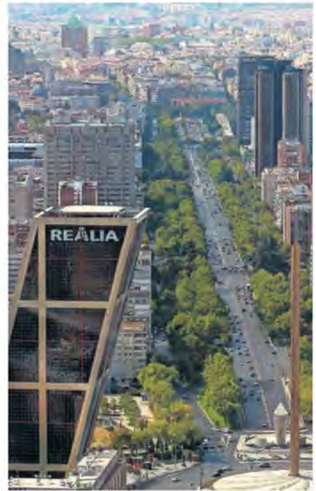
Zona de oficinas de Azca y eje de la Castellana en Madrid. PABLO MUNGE

Sobre el perfil de los compradores que destacan en 2018, "se mezclan todo