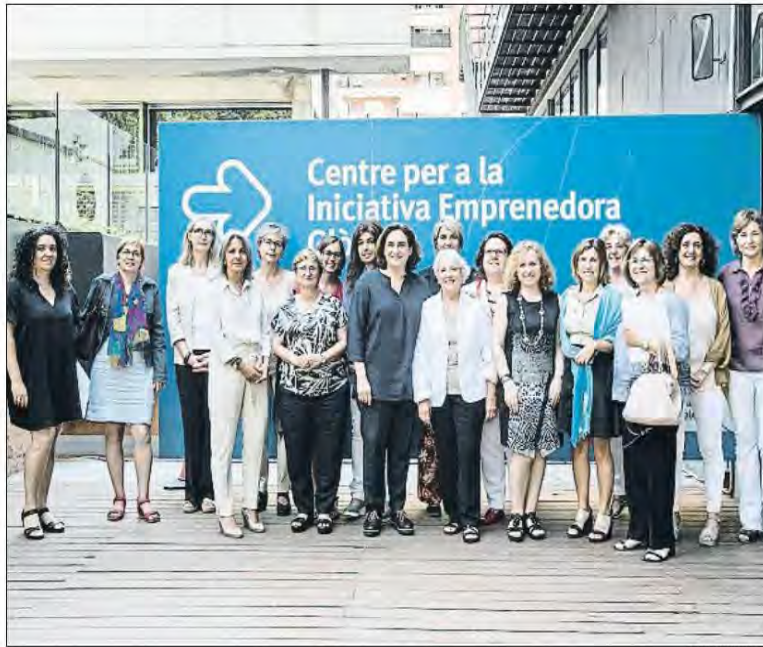
La alcaldesa rodeada con el grupo de empresarias con las que ayer dialogó en Barcelona Activa

Entre las asignaturas pendientes en las que las directivas se conjuran en trabajar está el asesoramiento a aquellas mujeres que consiguen crear su propio negocio. “Tienen acompañamiento en el inicio, pero luego, en el momento más delicado, que son los tres primeros años, en los que muchas fracasan, se sienten solas”, explicó una de las presentes. Para este colectivo se propuso aportar algún tipo de apoyo emocional y